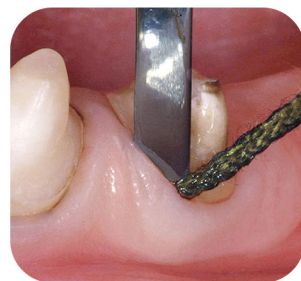
Prevent bleeding by cord soaked in a hemostatic solution