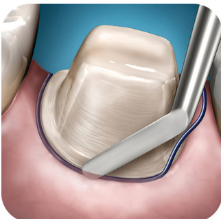
جایگذاری نخ زیر لثه آغشته به محلول هموستاتیک