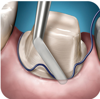
جایگذاری نخ زیر لثه آغشته به محلول هموستاتیک