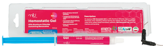
1 x 3/5 cc 1 Micro tip