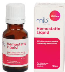
18 cc Jar