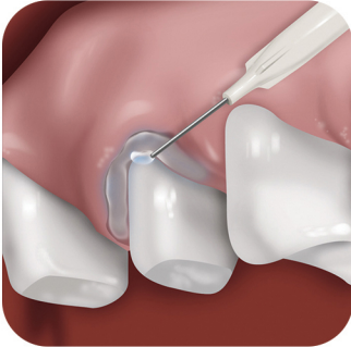
کنترل خونریزی بافت پریودنتیک با استفاده از ژل هموستاتیک

MIB Hemostatic Gel ژل آلومینیوم کلراید ۲۵% بی رنگ با ویسکوزیته مناسب است، که در محل زخم باقی مانده و جاری نمی‌شود. با توقف سریع خونریزی و بدون بر جای گذاشتن اثرات رنگی قابل استفاده در ناحیه قدامی و استتیک (Esthetic) است.